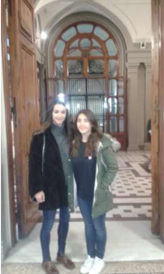
Lycée Victor Hugo. Florencia. 2016-2017