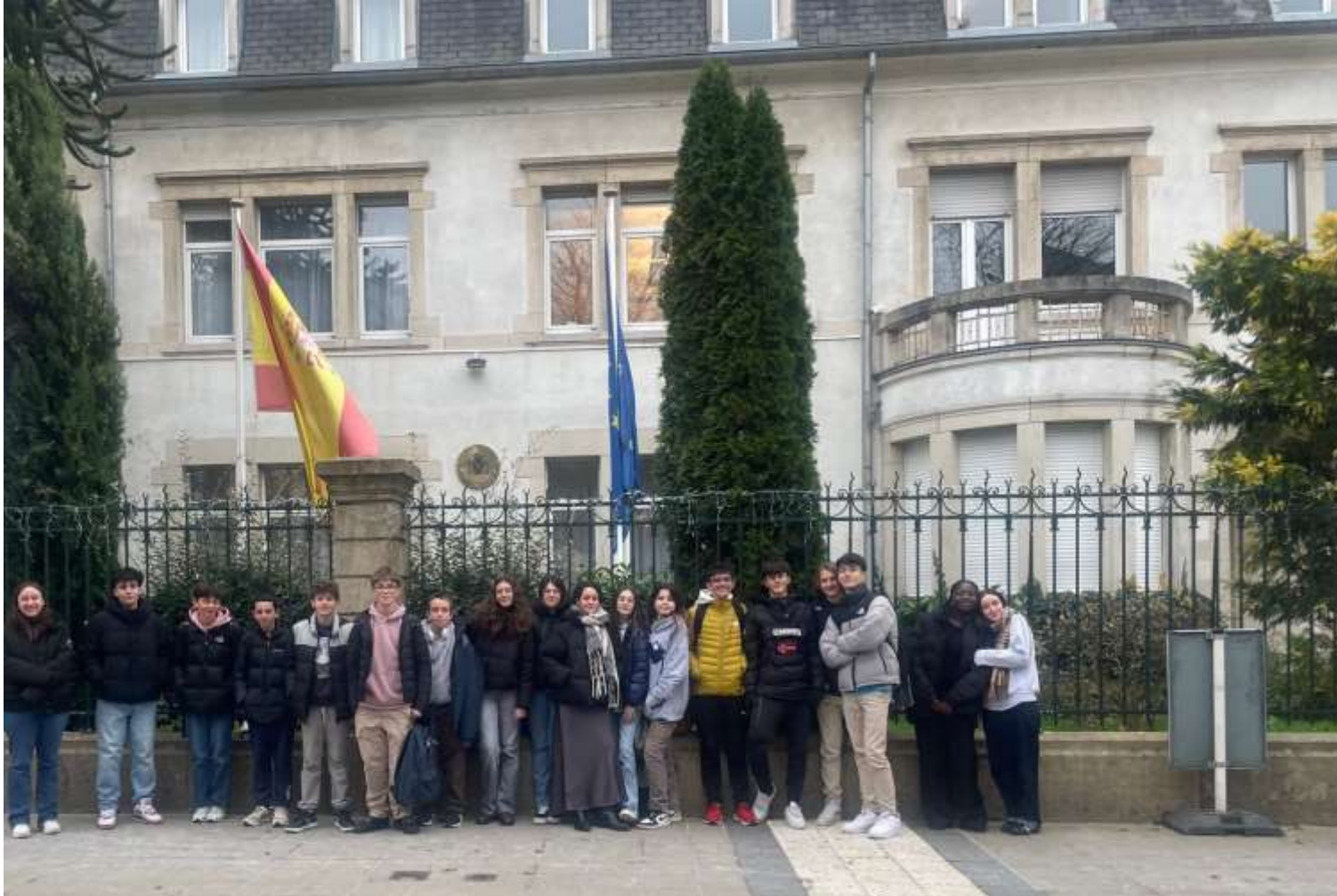
Lycée Vauban. Luxemburgo, 2024-2025. Ante el Consulado español.