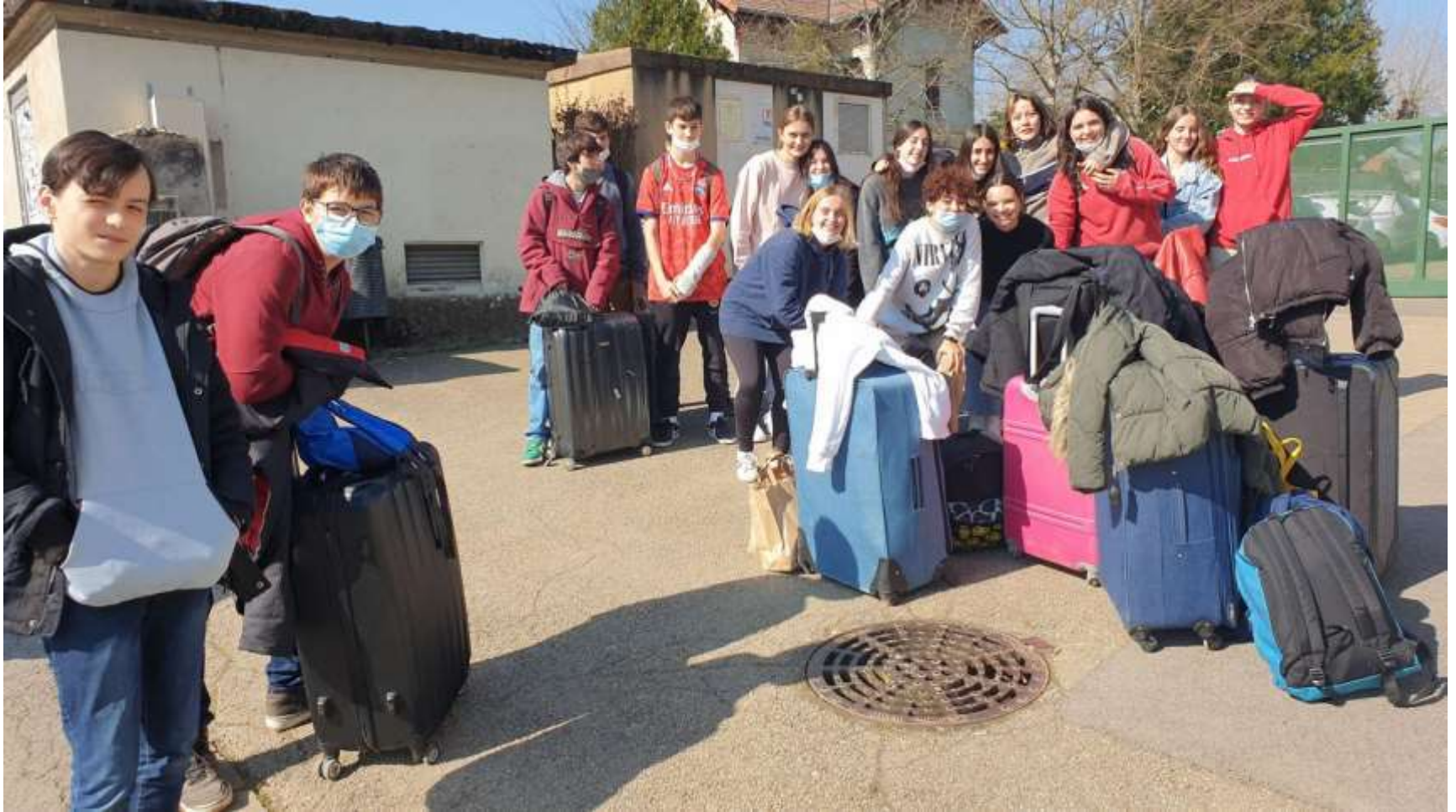
Lycée La Prat's. Cluny, 2021-2022.