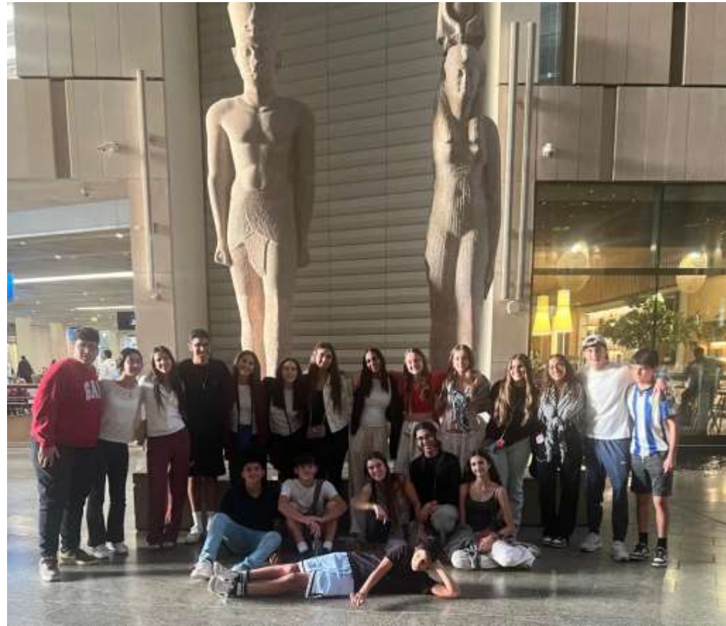
Lycée Français d'Alexandrie. Egipto, 2024-2025