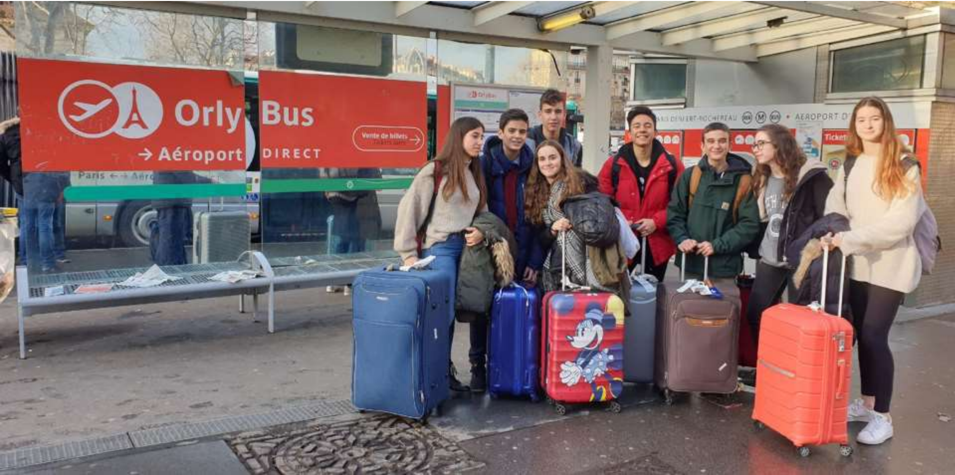
Lycée Rodin, Paris. 2019-2022.