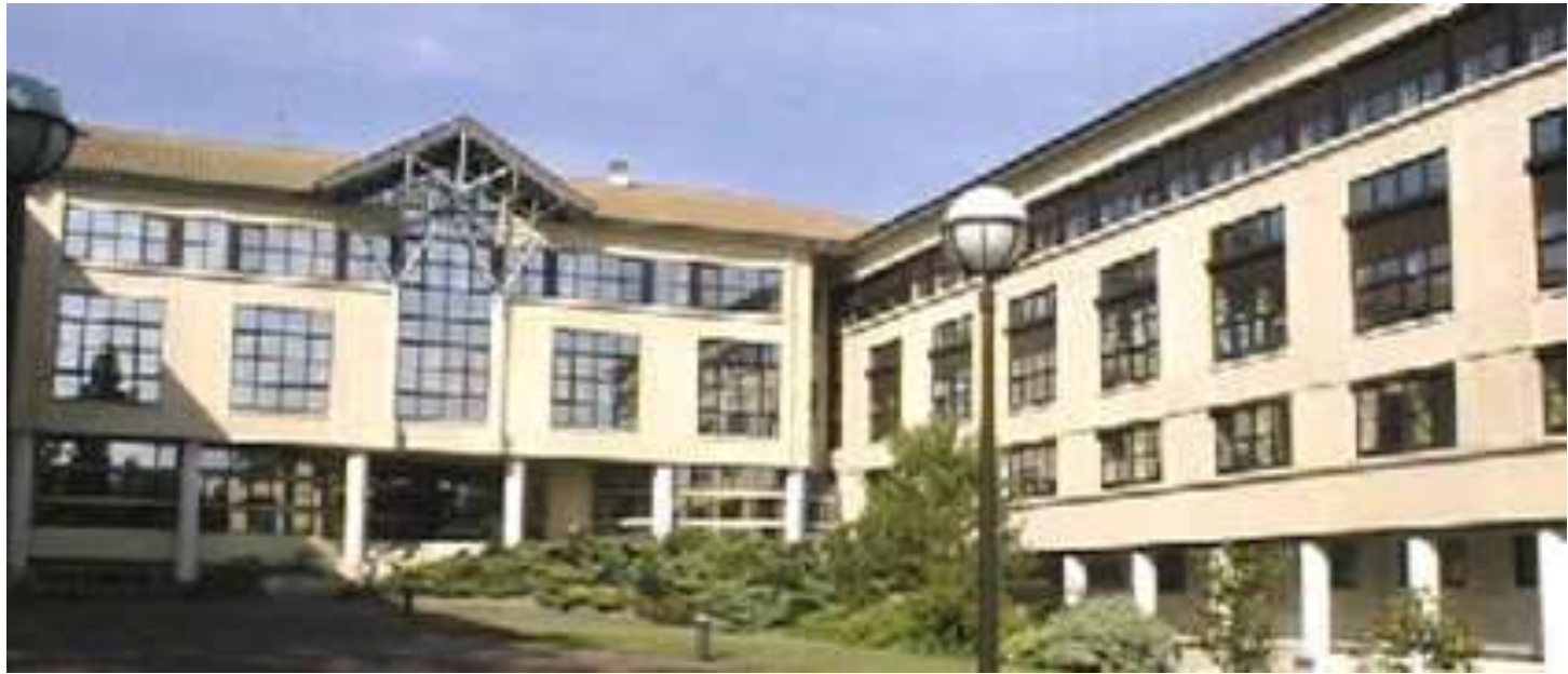
Lycée La Prat's. CLUNY (Bourgogne) Francia