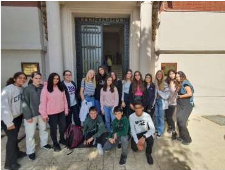
Aleandría. Egipto, 2022-2023.