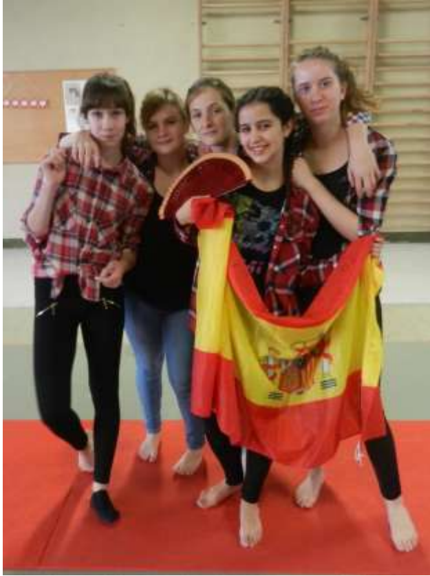
Collège Prud'hon. Cluny, 2015-2016